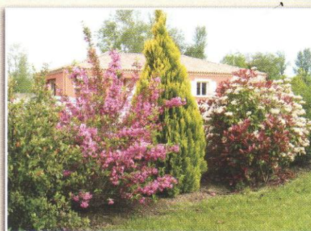
Weigela et photinia fleurissent en mai. Le thuya doré ajoute une touche de gaieté tout l'hiver.

NB : cette liste n'est pas exhaustive. Pour toute autre variété n'hésitez pas à nous consulter